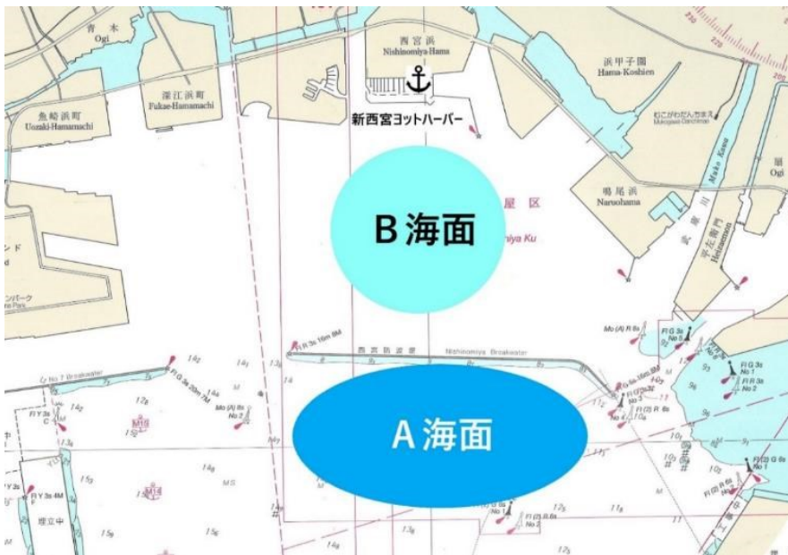
SI 添付図 A<レース・エリア図>

※上記に示すレース・エリアはレース・エリアの所在海域を示す図で有り、レース・エリア範囲を正確に示す図ではない。